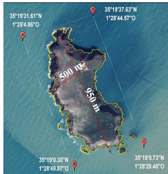
Figure 2. Coordonnées géographiques, longueur et largeur de l'île de Rachgoun (fond de carte, Image CNES/Astrium in Google Earth Pro 2016).

L'île de Rachgoun est située dans la circonscription administrative de la commune de Oulhaça El Gheraba, Daira de Oulhaça El Gheraba et la Wilaya d'Ain Témouchent, entre les coordonnées géographiques « A) 35°19'31.61"N , 1°29'4.86"O ; B) 35°19'0.30"N , 1°28'49.87"O ; C) 35°19'5.73"N , 1°28'29.48"O ; D) 35°19'37.63"N , 1°28'44.54"O » (Fig. 2). Elle s'étend sur une longueur de 950 m pour une largeur de 500 m sur la partie la plus large, occupant ainsi une superficie de 28,5 ha. L'île Layella est située approximativement à moins d'un mile nautique (1700 m) du Cap Accra considéré comme le point le plus proche de l'île du côté continental. Elle est également sous l'influence directe de l'Oued Tafna qui se déverse sur la plage la plus proche de l'île (Plage de Rachgoun).