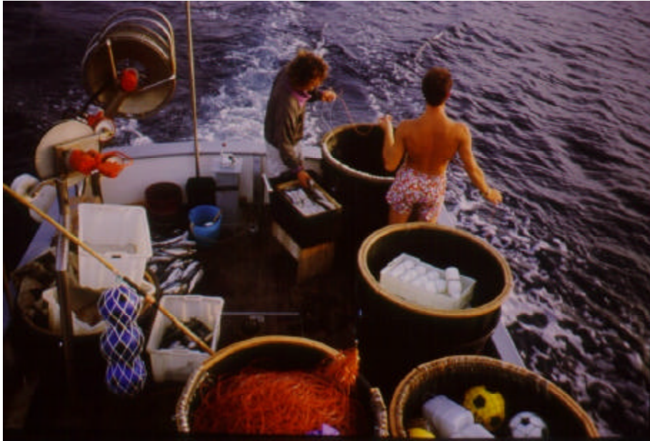
Les palangres flottantes des eaux méditerranéennes infligent une mortalité considérable sur les différents groupes d'organismes marins.

La taille de l'hameçon, le diamètre de la ligne principale et des avançons, l'espace entre les avançons, et la nature de l'appât fait les différences principales entre les modèles des palangres utilisées pour l'espadon, l'albacore ou le thon rouge :