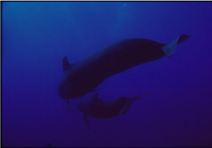
Globicephala melas est une espèce de cétacés de la mer méditerranéenne. Différents types d'interactions existent entre les populations de cétacés et les flottilles de pêche en Méditerranée. G.TORCHIA

En Méditerranée, il semble que l'activité des flottilles les plus répandues à senne coulissante ciblant les petits poissons pélagiques ne provoquerait pas des mortalités élevées des dauphins par les filets dérivants (Silvani et al., 1992; Di Natale, 1990). Cependant, Aguilar et al. (1991) ont enregistré des prises accidentelles fréquentes du dauphin commun et rayé par des sennes coulissantes au large des côtes de l'Espagne méridionale, de l'Italie méridionale et de l'Afrique du Nord (Encadré 5).