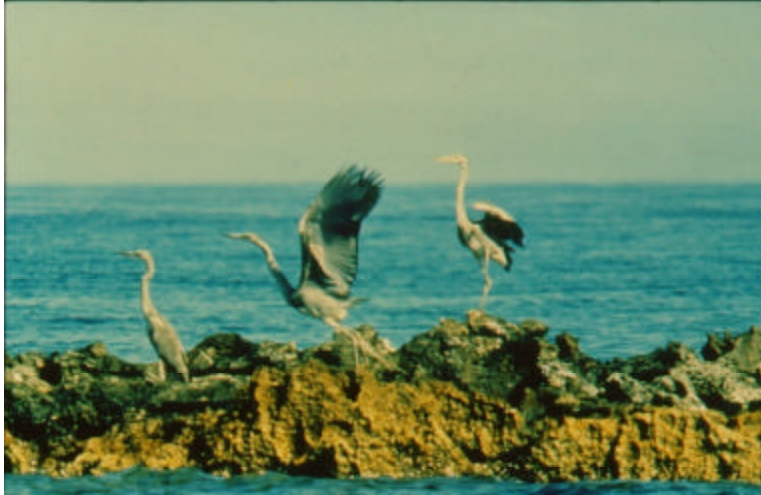
Beaucoup d'attentions doivent être accordées à l'impact des pêcheries méditerranéennes sur les populations des oiseaux marins. A. Demetropoulos © CAR/ASP.