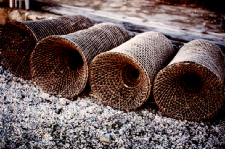
les nasses sont des engins typiques de pêche traditionnelle méditerranéenne D.ceberian

Il est bon de noter que la pêche du thon au filet-piège ("tonnara", "almadraba", "madrague") connaît actuellement un regain d'intérêt du fait du prix élevé du gros thon rouge. Les activités relatives à cette pêche semblent affecter, essentiellement, les gros cétacés (Anonyme, 1994) et les requins (tel que le requin blanc). Ces animaux sont occasionnellement capturés, mais sont relâchés vivants la plupart du temps.