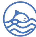
Cartilaginous fishes (Chondrichthyans)